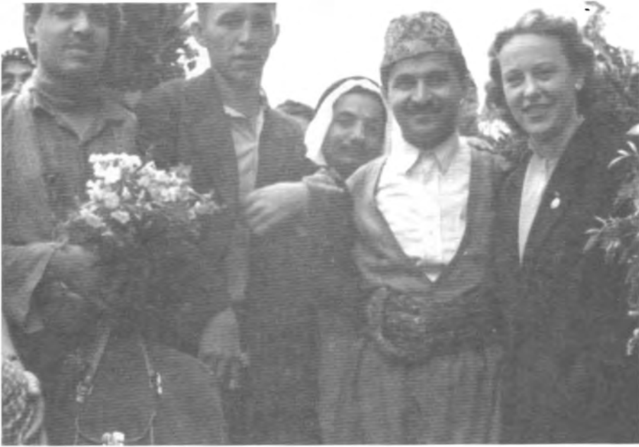
فېستىۋالى لاوان لە مۇسكۆ